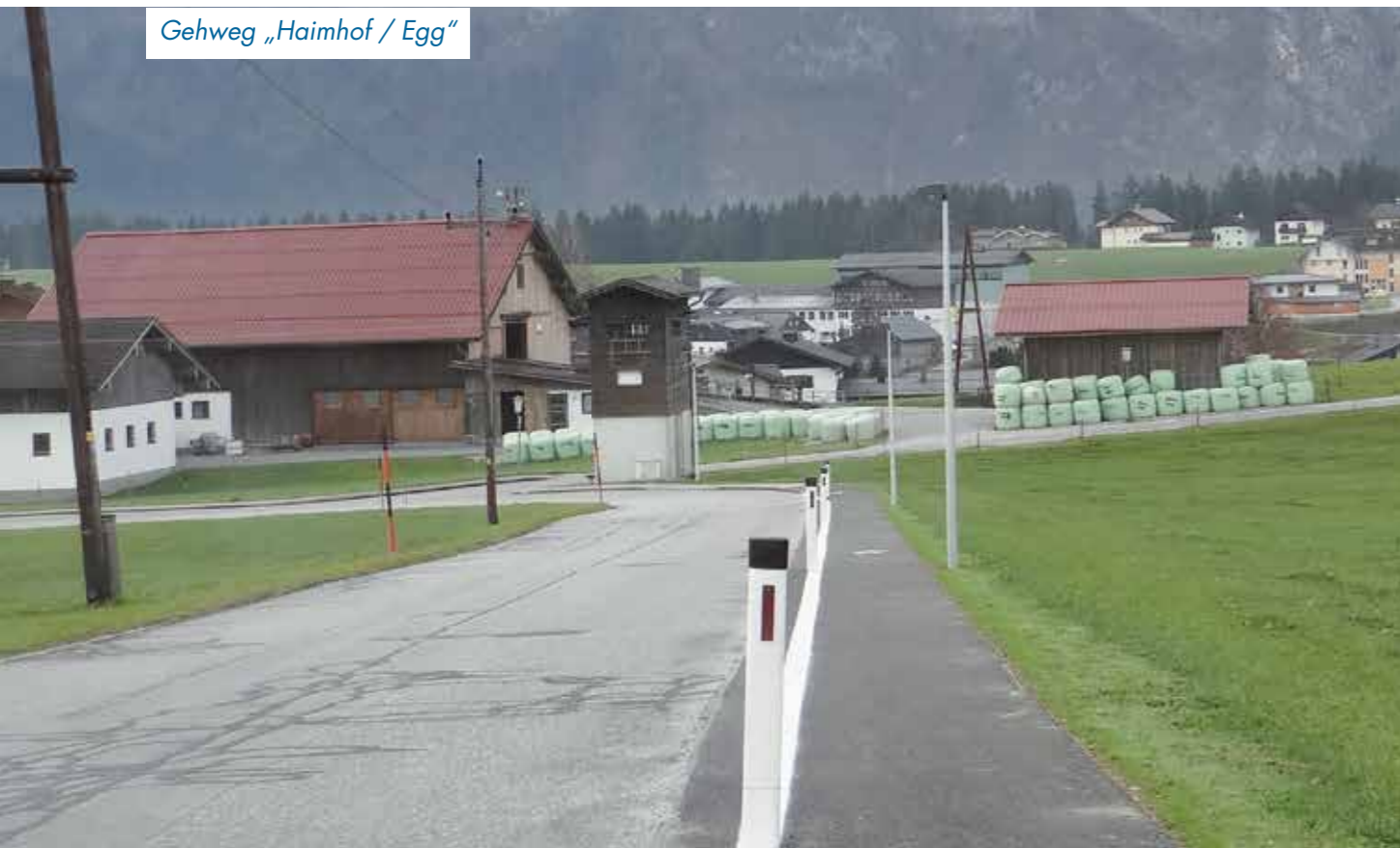
Gehweg „Haimhof / Egg“