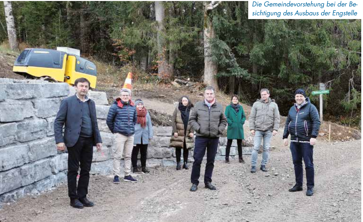
Die Gemeindevorstellung bei der Besichtigung des Ausbaus der Engstelle