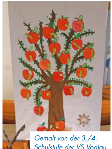
Gemalt von der 3./4. Schulstufe der VS Voglau

Anlässlich des 90-jährigen Bestehens lud der Obst- und Gartenbauverein am Wochenende vom 9. bis 11. Oktober 2020 zu einer Obstausstellung mit unterschiedlichen Apfel- u. Birnensorten ein.