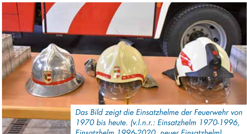
Das Bild zeigt die Einsatzhelme der Feuerwehr von 1970 bis heute. (v.l.n.r.: Einsatzhelm 1970-1996, Einsatzhelm 1996-2020, neuer Einsatzhelm)